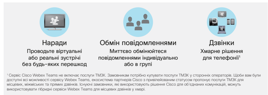
Рис. 1. Спілкуйтеся ефективніше за допомогою Cisco Webex Teams

Комунікація має бути гнучкою та мобільною, а також сприяти спільній роботі. Усе це досягається завдяки інноваційним мобільним пристроям, інфраструктурі та програмам. За допомогою Cisco Webex Teams можна ефективно спілкуватися і проводити наради в реальному часі через інтегрований набір найкращих у галузі інструментів для спільної роботи.